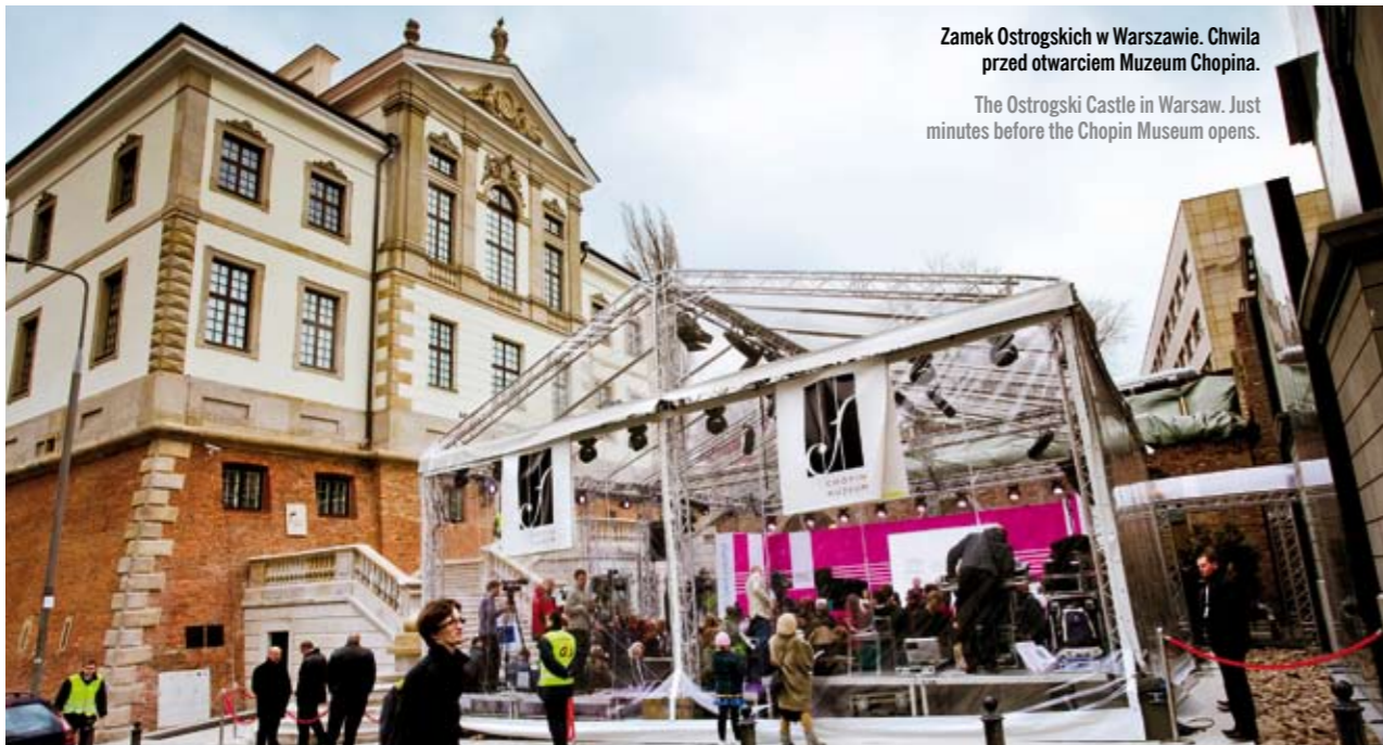
Zamek Ostrogskich w Warszawie. Chwila przed otwarciem Muzeum Chopina.

The Ostrogski Castle in Warsaw. Just minutes before the Chopin Museum opens.